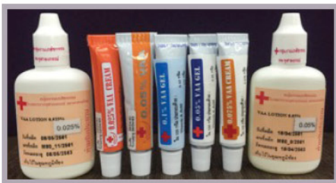
กลุ่ม Retinoid หรืออนุพันธ์ของวิตามินเอ

สำหรับผลิตภัณฑ์ที่กลุ่มงานเภสัชกรรม โรงพยาบาลจุฬาลงกรณ์ สภากาชาดไทย ได้คัดค้นพัฒนาสูตรตำรับและผลิตขึ้นมาใช้ภายในโรงพยาบาลเพื่อรักษาสิว ในปัจจุบันมีรูปแบบต่างๆ ดังนี้