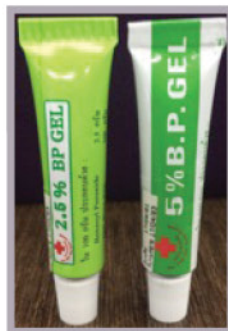
Benzoyl Peroxide (BP)

ยาในกลุ่มนี้ใช้สำหรับรักษาสิวยุดตัน ผลิดออกมาทั้งในรูปแบบครีม เจล และโลชั่น สำหรับรูปแบบครีมและโลชั่นจะมีความเข้มข้นของตัวยายอยู่ 3 ระดับให้เลือกใช้ คือ 0.025%, 0.05% และ 0.075% บรรจุหลอดขนาด 5 กรัม และโลชั่นบรรจุขวดขนาด 30 ซีซี ส่วนรูปแบบเจลบรรจุหลอดขนาด 5 กรัม มีความเข้มข้นของตัวยาย 2 ระดับ คือ 0.05% และ 0.1% ซึ่งจะใช้ยาความเข้มข้นเท่าใดหรือรูปแบบใดนั้นขึ้นอยู่กับอาการพิจารณาของแพทย์เป็นสำคัญ